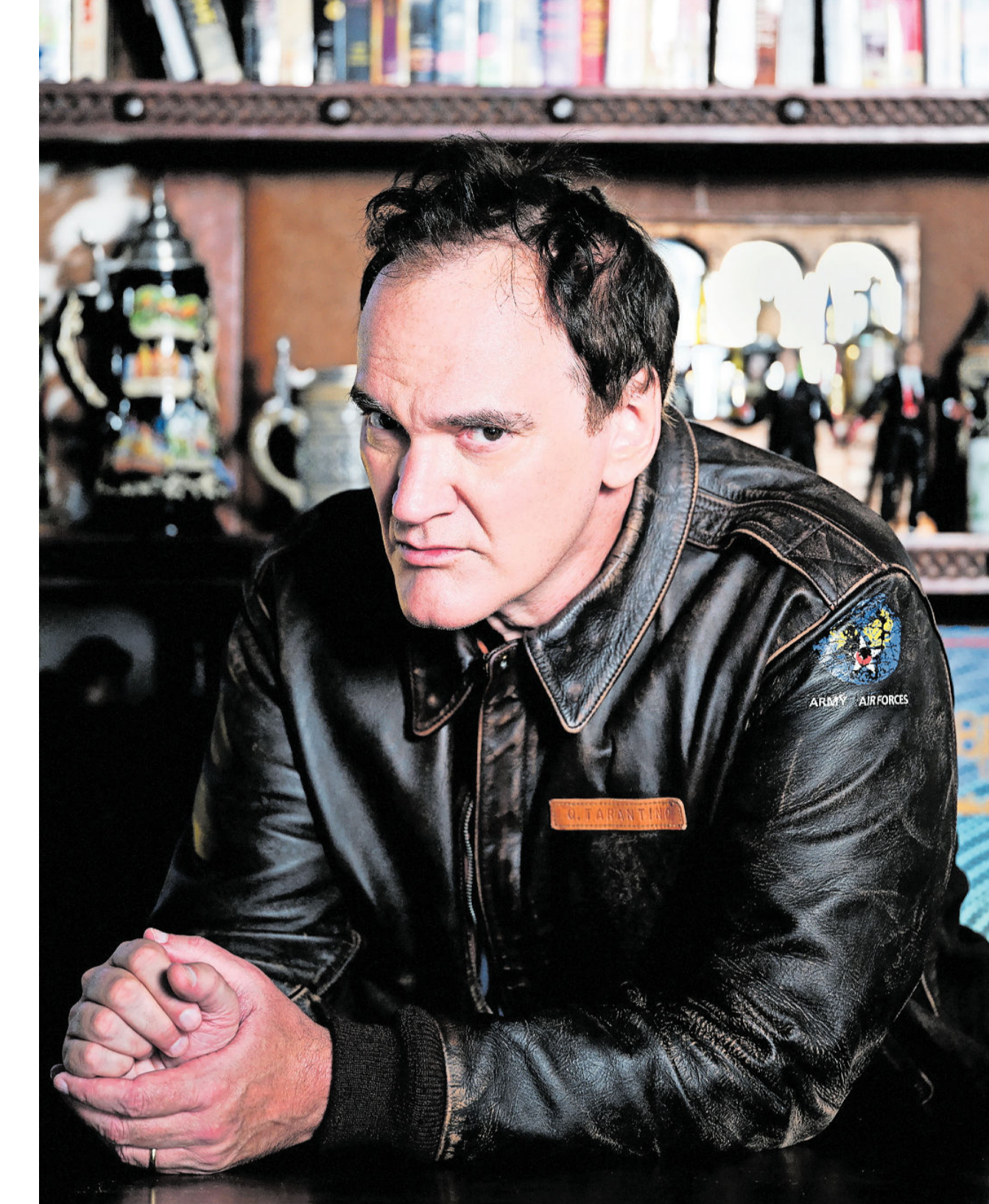
„Manche Eltern wollten wegen der heftigen Filme, die ich schaute, nicht einmal mehr, dass ich in der Schule mit ihren Kindern spielte“, berichtet Quentin Tarantino in „Cinema Speculation“.

Aus diesen Erfahrungen entsteht in „Cinema Speculation“ zunächst einmal ganz