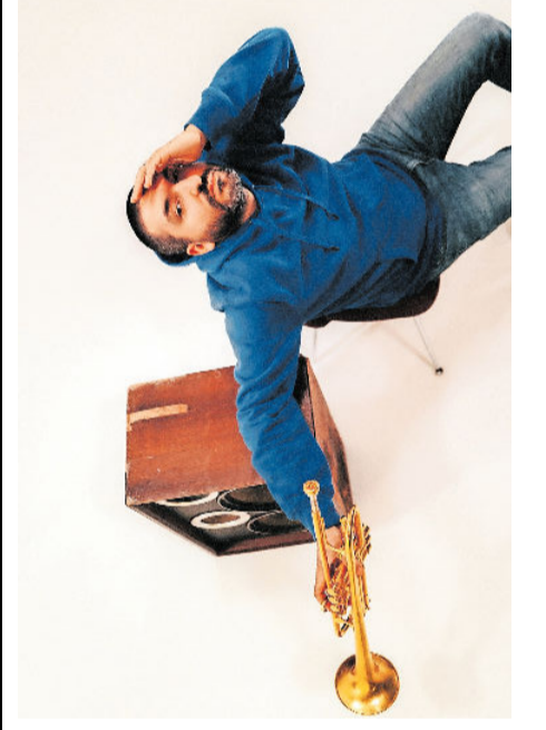
Wer professionell Trompete spielt, müsse auch „ein wenig seltsam sein“: Ibrahim Maalouf.

Maalouf versteht das. 25 Jahre lang hat er Klassik gespielt. Ursprünglich kommt er aus der Tarab, der traditionellen arabischen Musik. Jetzt ist da Jazz, die Mischung mit Pop, Weltmusik, seine verschiedenen Kooperationen mit Rappern, Sängern und Sängerinnen. „In Japan zum Beispiel kamen die Leute nach dem Konzert einmal zu mir und meinten: ‚Das ist kein Jazz!‘ Ich sagte: ‚Das ist mir nicht so wichtig. Hat es ihnen denn gefallen?‘ Die Antwort war dann: ‚Ja. Aber es ist kein Jazz!‘“